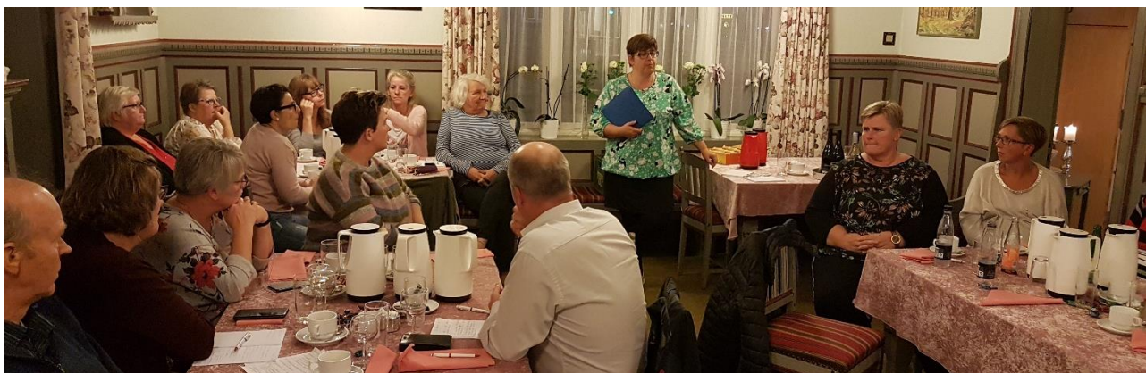
Fra områdegeneralforsamlingen i Område Nordvestsjælland.

Der afholdtes ordinære områdegeneralforsamlinger i uge 40 i 2019, hvor blandt andet næstformændene var på valg, dog uden modkandidater.