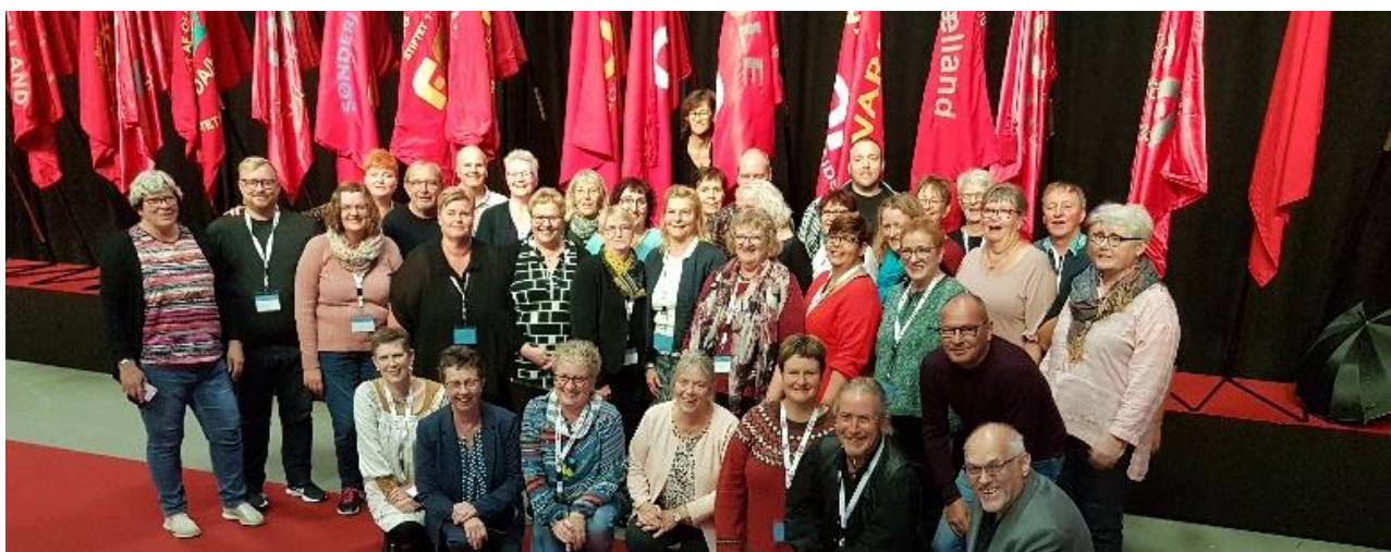
FOA Vestsjællands kongresdelegerede – i baggrunden skimtes afdelingens nye fane!

FOA Vestsjælland deltog med en delegation på 33 personer, inklusive de som deltog som forbundsdelegerede i kraft af deres placering i Hovedbestyrelsen eller de centrale sektorbestyrelser. Derudover deltog afdelingens kongres-suppleanter.