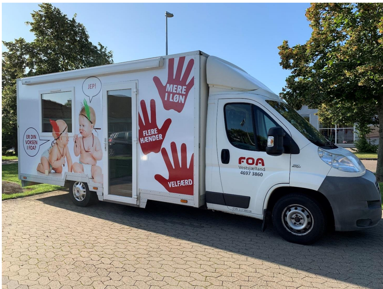
FOAs "Kontorbus" er indrettet med et lille mødebord som også kan fungere som mobile arbejdspladser, toilet, et lille køkken, EL og varme, hylder med informationsmaterialer, persienne samt et toilet. Der er plads til 3 personer under kørsel.